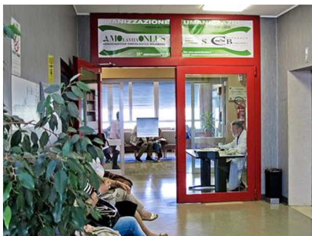
La sala d'attesa e accoglienza Malati