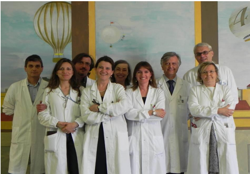
I medici dell'Unità Operativa di Oncologia del Presidio S. Carlo