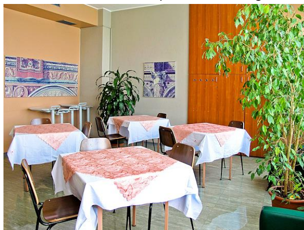
Sala da pranzo degenti