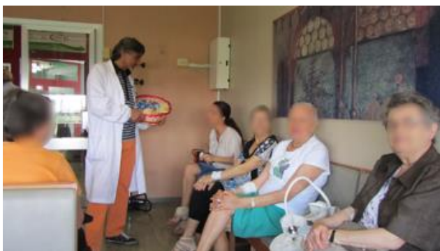
Un volontario con i pazienti in sala d'attesa

I volontari, iscritti nel registro dei volontari, e che hanno prestato la loro opera nel corso dell'esercizio 2019 sono stati 48 e una parte di loro sono i medici specialisti e il personale infermieristico del Presidio San Carlo.