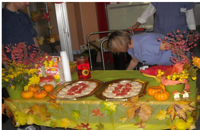
I colori dell'Happy Hour

5) “Apericena” sabato sera – realizzato con cadenza mensile, nella serata del sabato si sono svolte le apericene (abbondanti aperitivi che possono sostituire la cena) alle quali sono intervenuti pazienti e familiari; tali avvenimenti hanno sempre riscosso molto successo con conseguente consolidamento dell'immagine della nostra ONLUS.