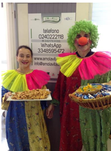
Carnevale con chiacchiere

2) Festività - durante le festività: Natale, Capodanno, Befana, San Valentino, Festa della Donna, Festa del Papà, Festa della Mamma, ecc. vengono organizzate attività atte a contenere l'ansia dei pazienti e, a seconda della tipologia della festa, vengono distribuiti beni inerenti la Festa da ricordare ( esempio i dolci denominati "chiacchiere" in ricorrenza del carnevale, panettone a Natale e Capodanno, ecc. ).