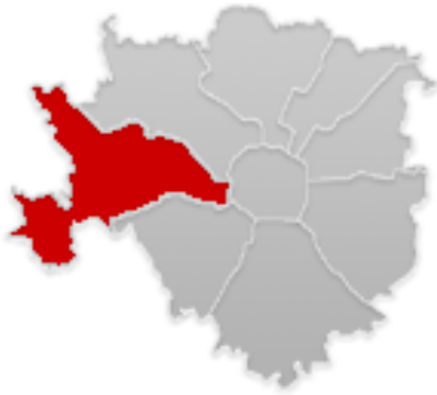
La Zona 7

La ONLUS Amo la Vita è nata ed opera nella Regione Lombardia ed in modo specifico nel Comune di Milano con particolare riferimento alle Zone 6 e 7 della Città