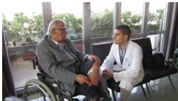
Ascolto e sostegno