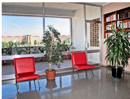
Balcone reparto di oncologia