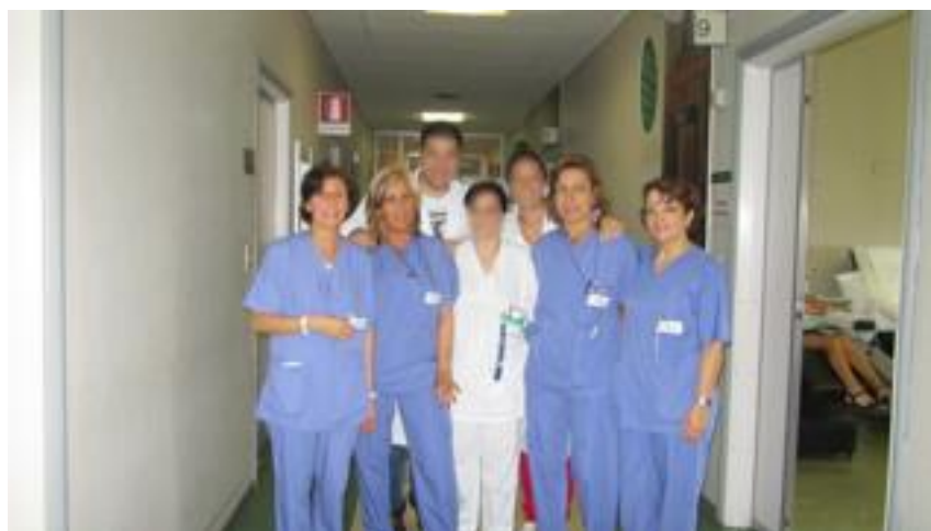
Il Personale Infermieristico dell'U.O. di Oncologia Medica.