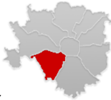
La Zona 6

Nella Zona 7 si trova la sede della ONLUS presso l'ASST Santi Paolo e Carlo Presidio San Carlo. Nella Zona 6 si trova il Presidio San Paolo con il quale la ONLUS collabora.