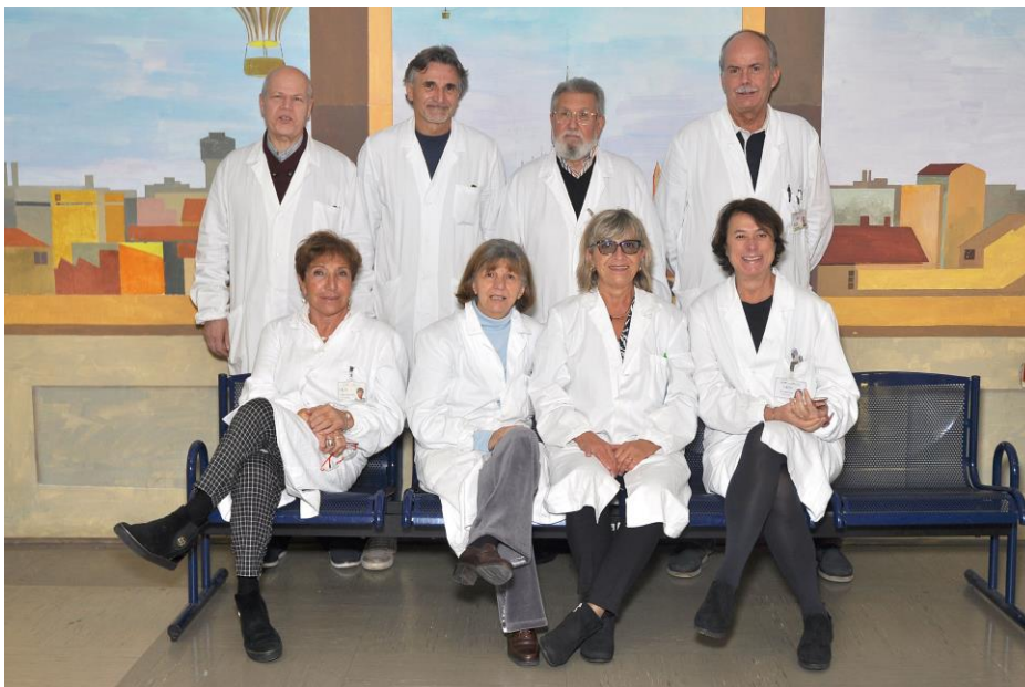
Lo staff di una parte di volontari attivi quotidianamente presso la ONLUS