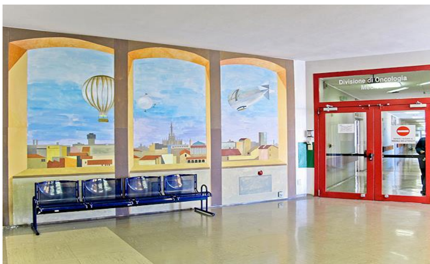
La Divisione di Oncologia del Presidio S. Carlo con pitture murali

Nella Zona 7 si trova la sede della ONLUS presso l'ASST Santi Paolo e Carlo Presidio San Carlo. Nella Zona 6 si trova il Presidio San Paolo con il quale la ONLUS collabora.